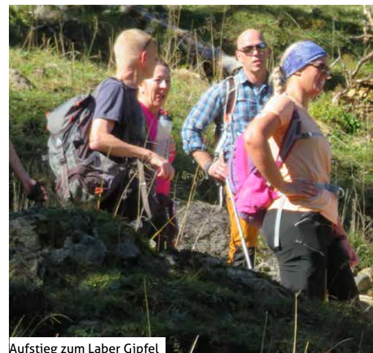
Aufstieg zum Laber Gipfel

Dort hatte sich der Nebel verzogen, und die Sonne strahlte von einem wolkenlosen Himmel. 828 Höhenmeter bis zum Gipfel, ausgesucht und geführt durch Fritz Wolf, waren zu überwinden, was so manchen an die Grenzen der Fitness brachte.