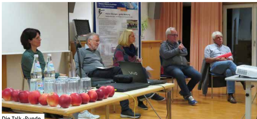
Die Talk -Runde