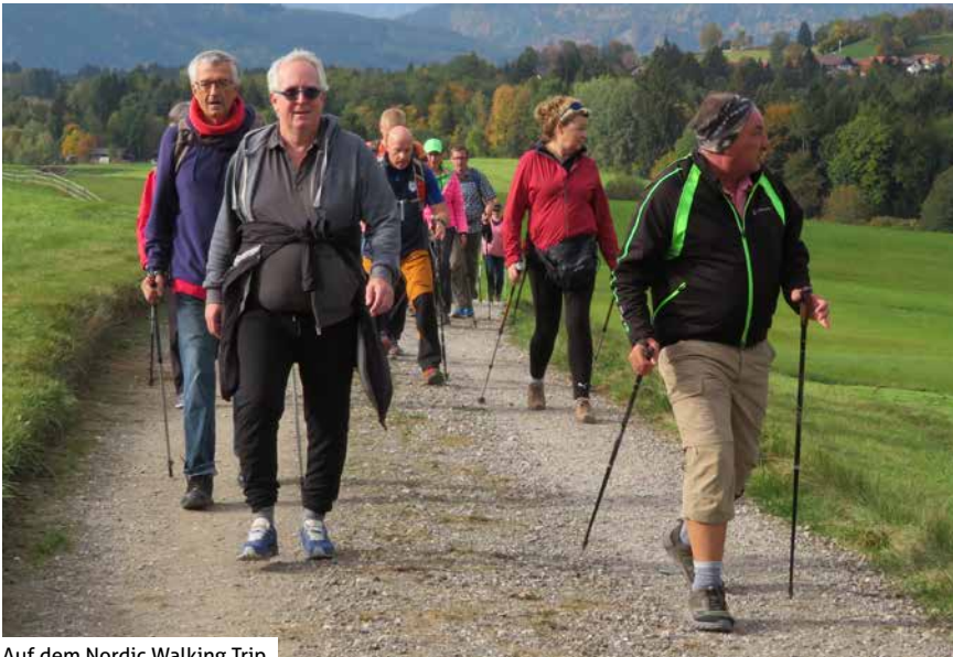
Auf dem Nordic Walking Trip

Wie im Jahr zuvor wurde das Seminar mit den Klängen der Kuhglocke aus dem Haus Unterjoch eingeläutet. Am Nachmittag konnten sich alle Teilnehmer*innen, angepasst an den individuellen Trainingszustand, im Umgang mit der gelben Filzkugel üben.