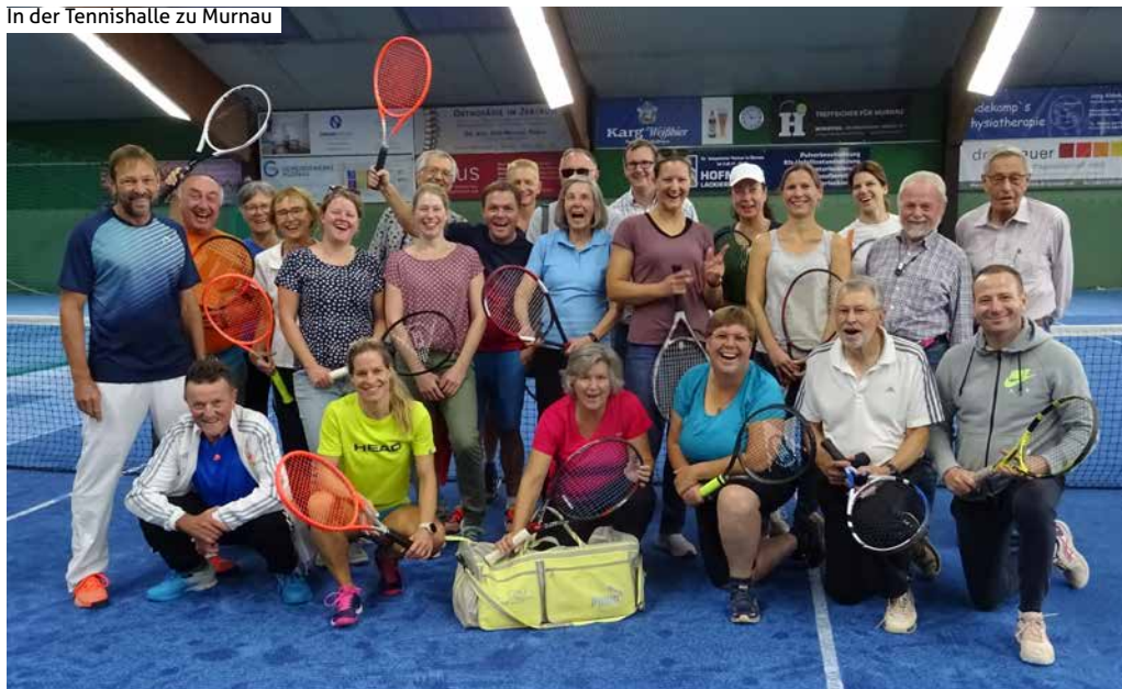
In der Tennishalle zu Murnau

Nach der Frühgymnastik wurde der Nordic Walking Parcours im Hügelland nördlich von Bad Kohlgrub absolviert. Bei noch freundlichem Wetter war auch dieser Trail bzgl. Insulinanpassung anspruchsvoll. Durch die Sensortechnik konnten alle sich anbahnende Hypoglykämien rechtzeitig erkannt und