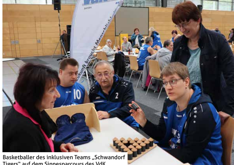
Basketballer des inklusiven Teams „Schwandorf Tigers“ auf dem Sinnesparcours des VdK.

Wenige Wochen vor ihrem Tod war auch die frühere Landtagspräsidentin Barbara Stamm zu Gast. Die langjährige Landesvorsitzende der Lebenshilfe sprach sehr eindrücklich über die Notwendigkeit von Inklusion und Barrierefreiheit.