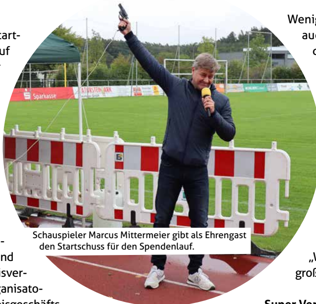
Schauspieler Marcus Mittermeier gibt als Ehrengast den Startschuss für den Spendenlauf.